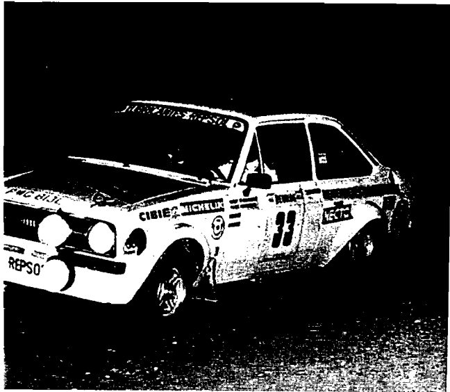
la ruota anteriore alzata si direbbe che Fernandez si sia abilitato alla terra che non conosce... Sotto Pregliasco e Reisolì anticipino tra la sorpresa degli spettatori