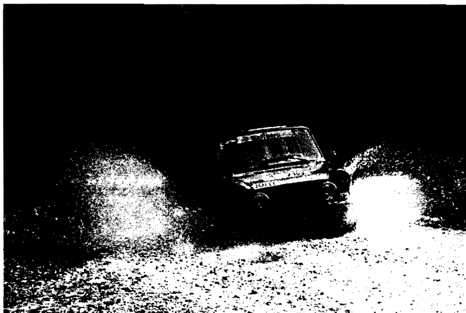
Fusaro in un tratto particolarmente impegnativo