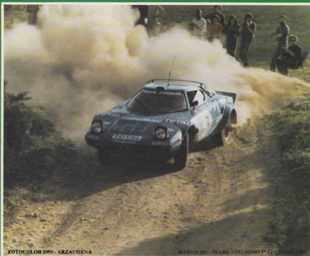
FOTOCOLOR 2000 - ARZACHENA